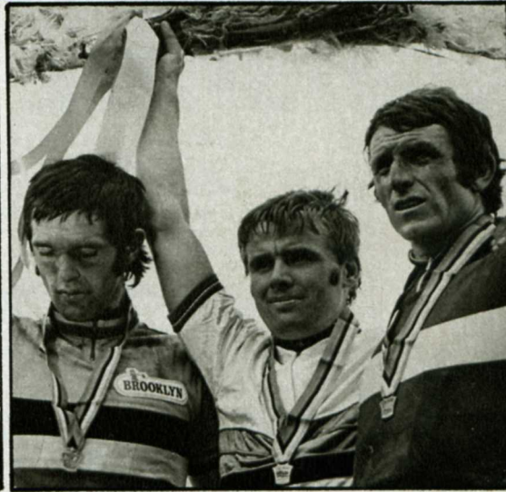
Drie belangrijke overwinningen uit de loopbaan van Hennie Kuiper : in 1972 wordt hij Olympisch kampioen in München (links onderaan), in 1975 wereldkampioen in Yvoir (hierboven op het podium tussen de ontgoochelde Roger De Vlaeminck en Jean-Pierre Danguillaume) en tien jaar later pakt hij de zege in Milaan-Sanremo