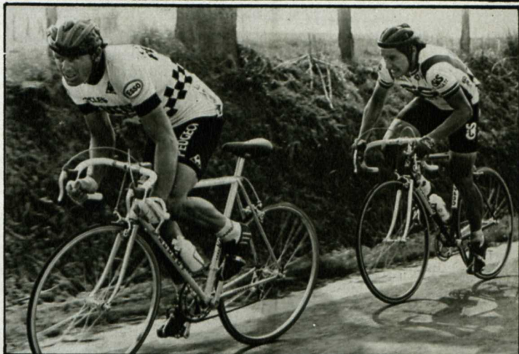
Hennie Kuiper won drie van zijn vier klassiekers onder de hoede van Fred De Bruyne. Op het kleurenbeeld uiterst links rijdt hij met Baronchelli voorop in de Ronde van Lombardije 1981, hij zal de Italiaan losgooien en onbedreigd winnen. Voordien had Kuiper al de Ronde van Vlaanderen op zijn naam geschreven (hierboven) en hij zegevierde in 1983 ook in Parijs-Roubaix (hiernaast). De Nederlander reed in het begin van zijn loopbaan ondermeer voor Rokado (op de foto helemaal bovenaan rechts met Wilfried David en Gerrie Knetemann) en verdedigde ook de kleuren van Peugeot (foto hierboven met Saronni tijdens de Waalse Pijl 1980)