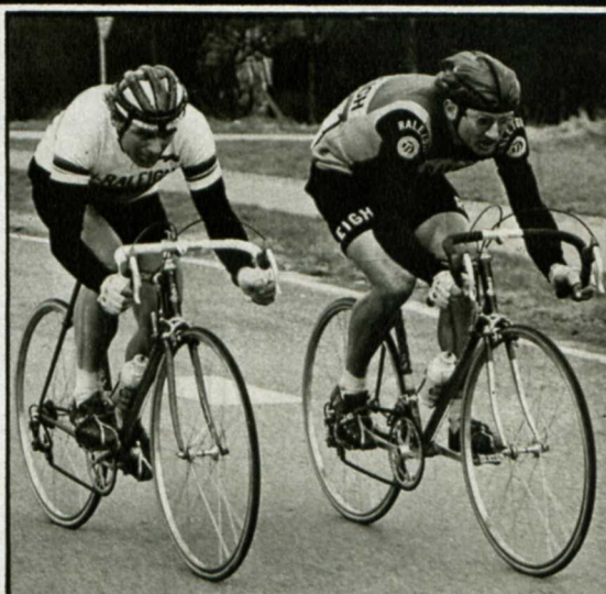
Hennie Kuiper was als wereldkampioen voortdurend vooraan te vinden in de klassiekers. Op de foto links zien we hem tijdens Parijs-Brussel 1975 met Didi Thurau, Frans Verbeeck, Eddy Merckx en Michel Pollentier, op de foto rechts met Jan Raas en Joop Zoetemelk tijdens de Amstel Gold Race 1976